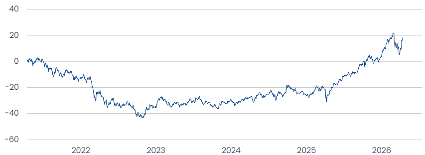
Templeton Emerging Markets Fund