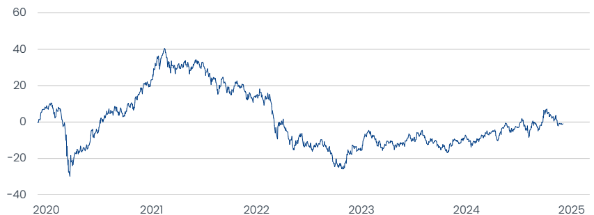
Templeton Emerging Markets Fund