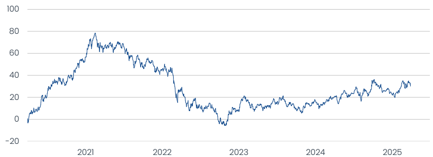
Templeton Emerging Markets Fund