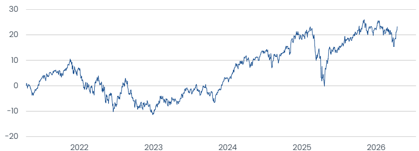
Franklin Global Fundamental Strategies Fund