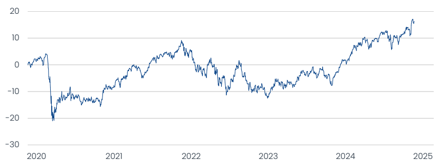
Franklin Global Fundamental Strategies Fund