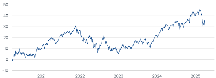
Franklin Global Fundamental Strategies Fund