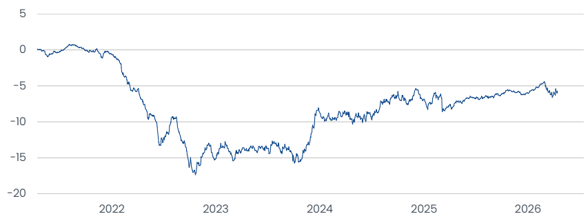
Franklin European Total Return Fund