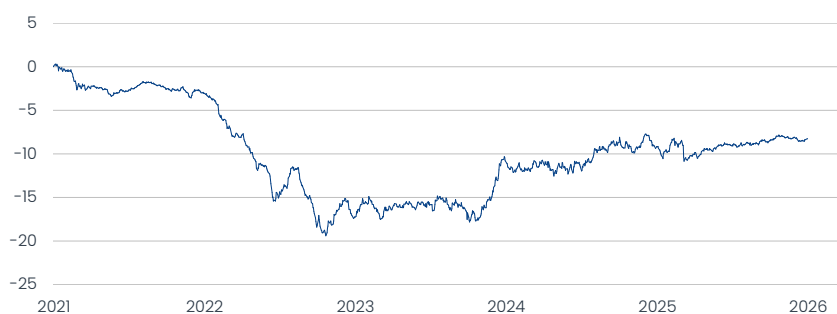
Franklin European Total Return Fund