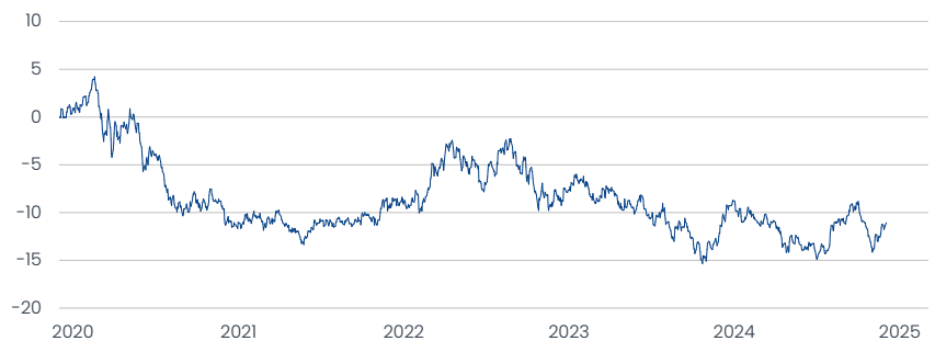
Templeton Global Bond Fund