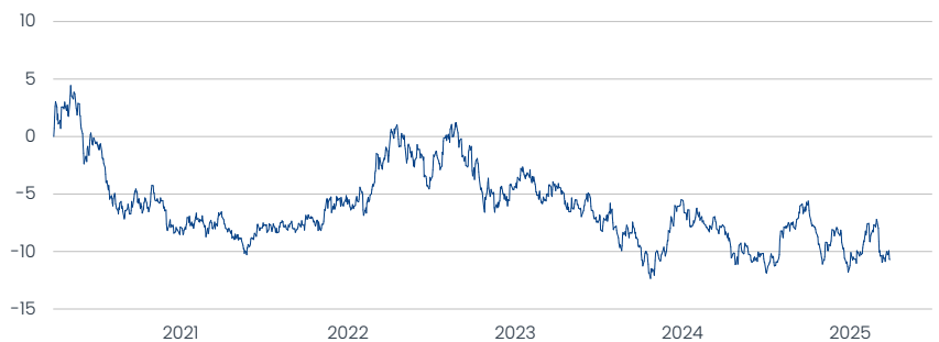
Templeton Global Bond Fund