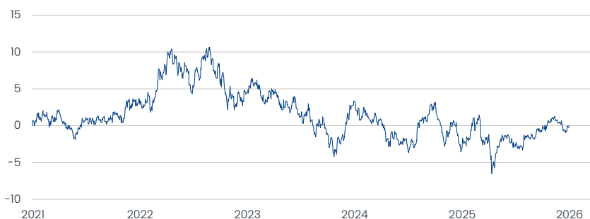
Templeton Global Bond Fund