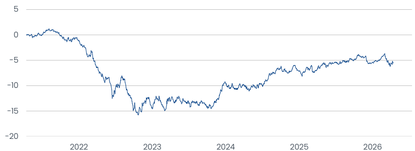
Apollo Global Bond ESG