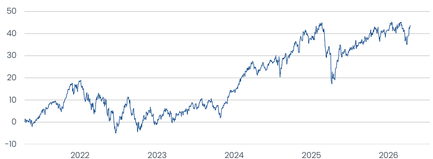
Kathrein ESG Global Equity