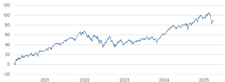
Kathrein Sustainable Global Equity