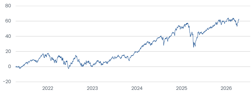
■ Apollo Styrian Global Equity