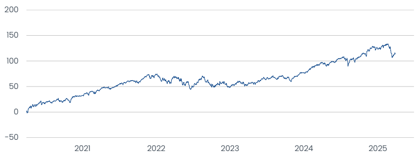
Apollo Styrian Global Equity