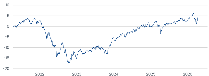
Value Investment Fonds Klassik