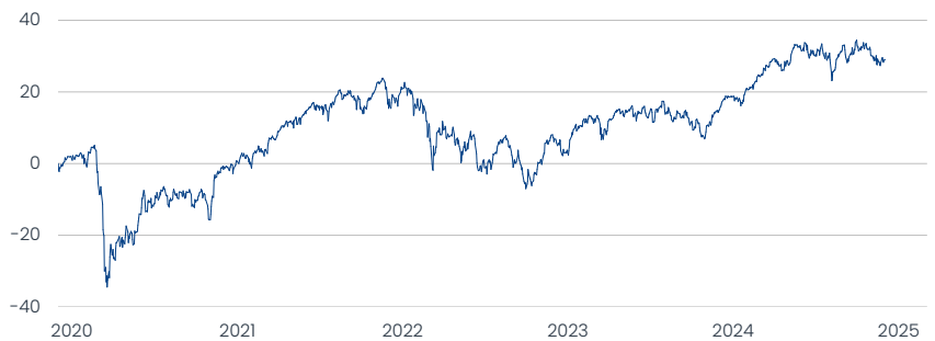
Apollo European Equity