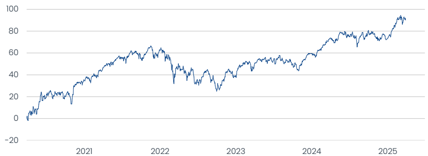
Apollo European Equity