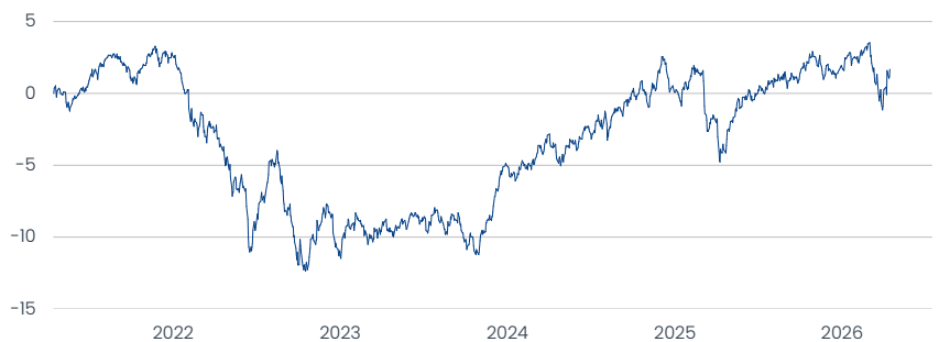
Amundi Ethik Fonds