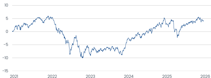
Amundi Ethik Fonds