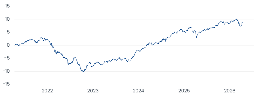
MI Multi Strategy ESG