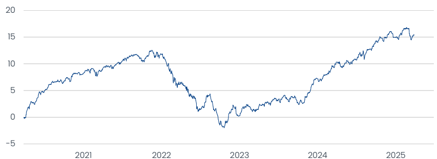
MI Multi Strategy SRI